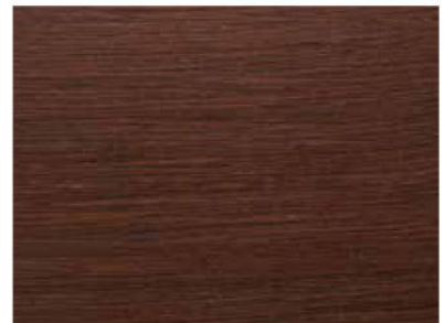
WENGÈ COD. 03/ST4