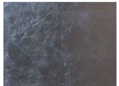
FOGLIA ARGENTO COD. F-AR

This sample collection is to be considered indicative. Wood is a natural material and may have differences in colours.