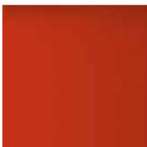
CORALLO COD. 3001M (OPACO) COD. 3001L (LUCIDO)