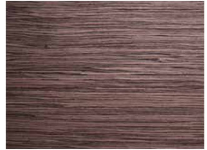
MALINDI COD. ST23