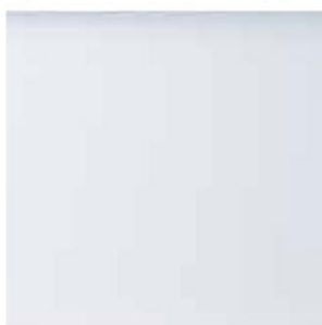
BIANCO COD. 9010M (OPACO) COD. 9010L (LUCIDO)