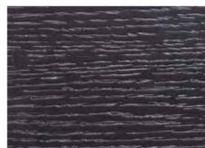
ANTRACITE COD. 02/ST13