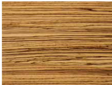
ZEBRANO NATURALE COD. 06/ST2