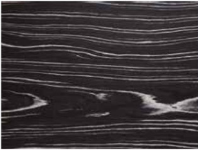
MAKASSAR COD. ST21