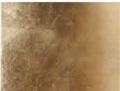
FOGLIA ORO COD. F-OR