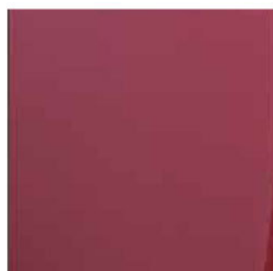
MELANZANA COD. 4004M (OPACO) COD. 4004L (LUCIDO)