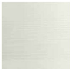
GHIACCIO COD. RK1