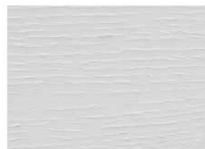
BIANCO PURO COD. 9010/ST11