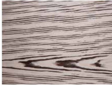
TUNDRA COD. ST22