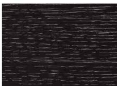
NERO PROFONDO COD. 04/ST12