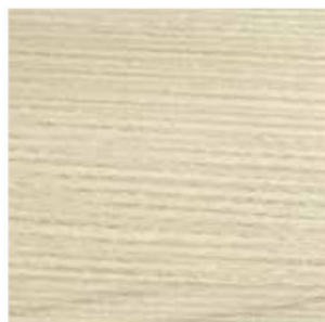
SABBIA COD. RK2