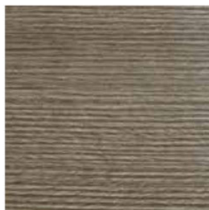
TABACCO COD. RK3