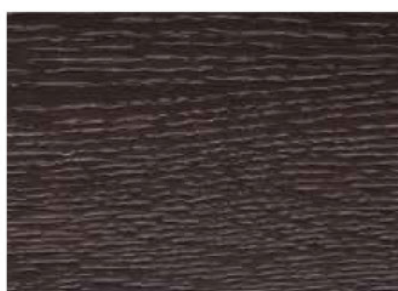
ROVERE MORO COD. ST14