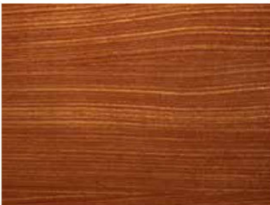
TEAK COD. 07