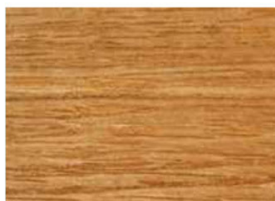
ROVERE NATURALE COD. 08