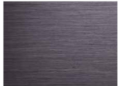
GREY COD. ST24

Verificare disponibilità Check availability