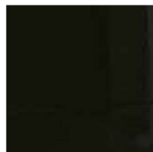
NERO COD. 9005M (OPACO) COD. 9005L (LUCIDO)

Il presente campionario è da ritenersi puramente indicativo in quanto, essendo il legno un materiale naturale, può presentare differenza a livello di venature e di conseguenza di tonalità nelle tinte.