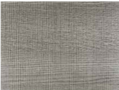
GRIGIO TRANCHE COD. ST25

Verificare disponibilità Check availability